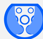
TYPE 2S (OPTIONNEL)