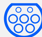
TYPE 2 STANDARD